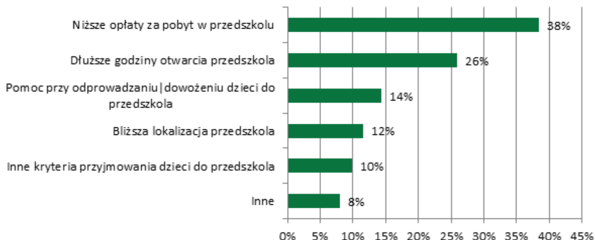
Wykres 2. Potrzeby zmian w funkcjonowaniu przedszkoli w opinii rodziców.

Opracowanie: Ryszard Necel Obserwatorium Integracji Społecznej Dział Koordynacji i Interakcji Społecznej